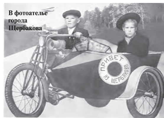
В фотоателье города Щербакова

И уж вовсе о фантастическом названии Рыбинска сообщила в 1903 году ярославская губернская газета «Северный край», написав, что «аборигены Рыбинска называют свой город Волжскими Афинами». Когда-то Афины были городом-государством, и ярославская газета тем самым отметила самодостаточность и независимость Рыбинска.