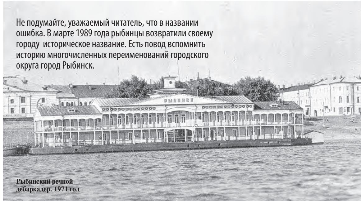
Рыбинский речной дебаркадер. 1971 год

Не подумайте, уважаемый читатель, что в названии ошибка. В марте 1989 года рыбинцы возвратили своему городу историческое название. Есть повод вспомнить историю многочисленных переименований городского округа город Рыбинск.