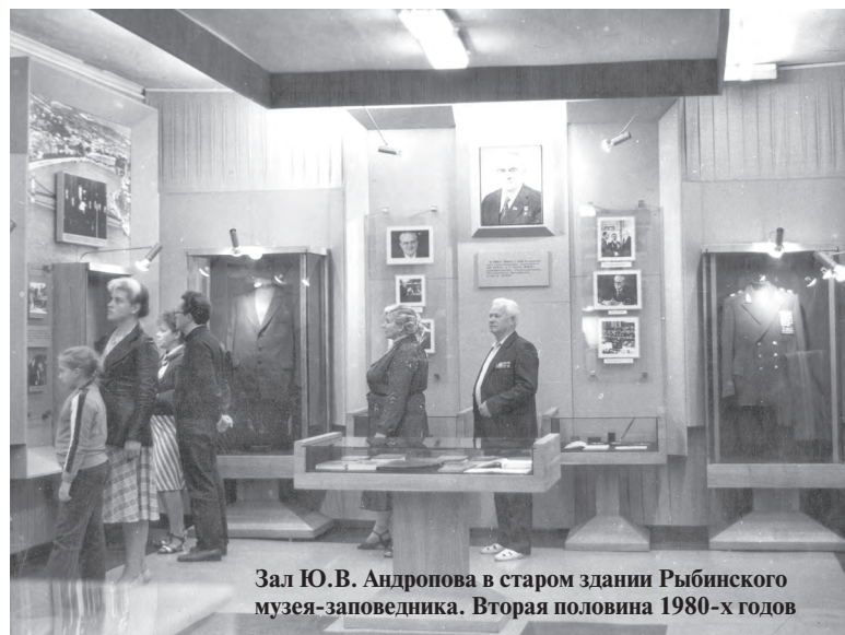
Зал Ю.В. Андропова в старом здании Рыбинского музея-заповедника. Вторая половина 1980-х годов

«Вследствие чего следующие селения переименовать городами: Рыбную слободу — город Рыбной...».