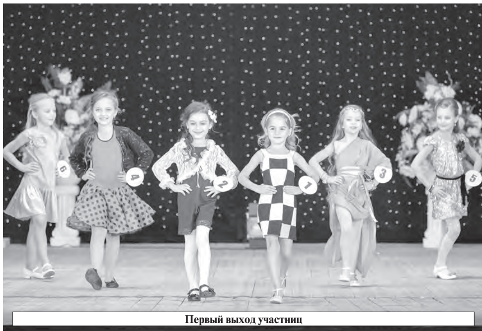
Первый выход участниц