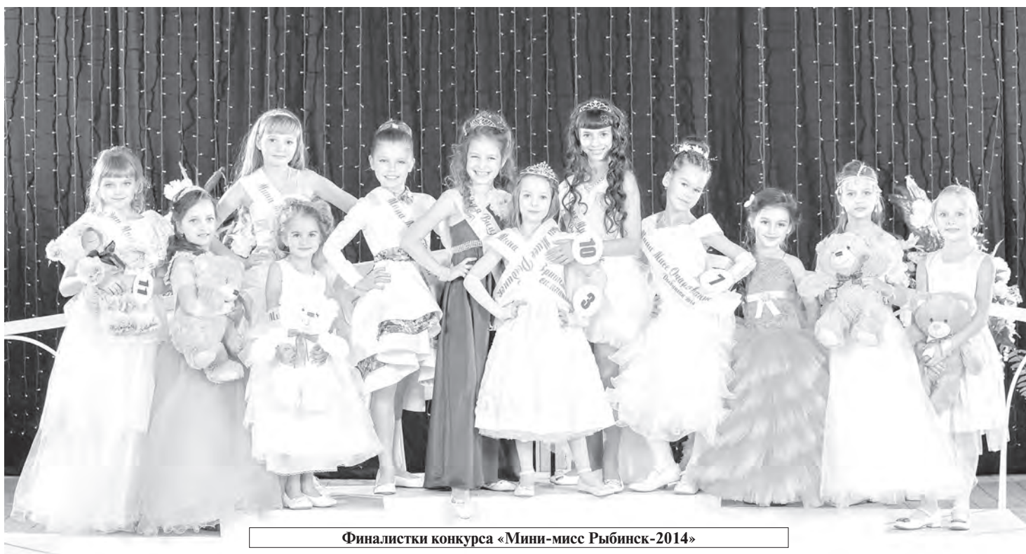
Финалистки конкурса «Мини-мисс Рыбинск-2014»