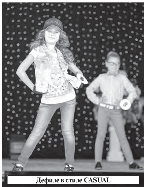
Дефиле в стиле CASUAL

29 ноября состоялся финал второго городского детского конкурса «Мини-мисс Рыбинск-2014», организованного EVENT-агентством «Русский праздник». Путь к большой сцене для маленьких рыбинских принцесс от 6 до 10 лет был долг и тернист.