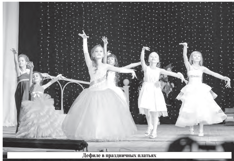
Дефиле в праздничных платьях