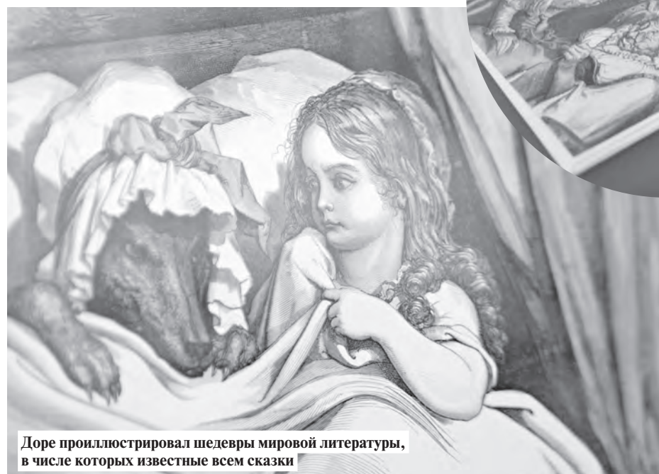
Доре проиллюстрировал шедевры мировой литературы, в числе которых известные всем сказки