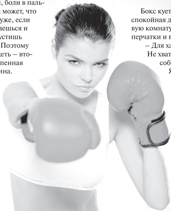
Девушки считают, что бокс — это лучший психолог

Сразу скажу, я удивилась мыслям тренера. Включился боевой настрой, и захотелось дать отпор, моральный, разумеется. Похудеть в широком спектре предлагаемых сегодня фитнес-направлений можно путем более щадящих нагрузок. Здесь же мазь от синяков — близкий друг и помощник. Кровоизлияния, отеки, боли в пальцах, а может, что и похуже, если зазеваешься и пропустишь удар. Поэтому похудеть — второстепенная причина.