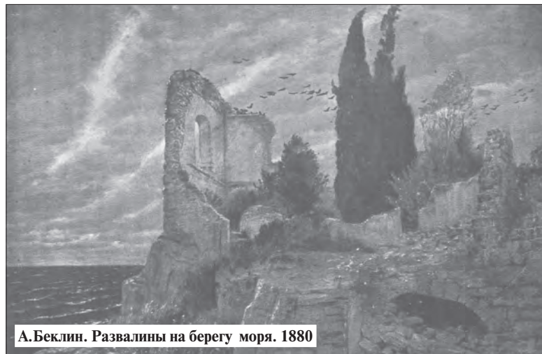
А.Беклин. Развалины на берегу моря. 1880