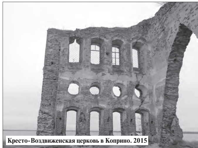
Кресто-Воздвиженская церковь в Коприно. 2015