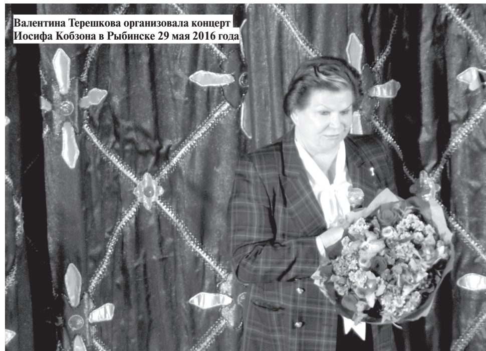
Валентина Терешкова организовала концерт Иосифа Кобзона в Рыбинске 29 мая 2016 года

Ну а мое знакомство с Валентиной Владимировной произошло в январе 2010 года в Демино, где в преддверии Зимней Олимпиады в канадском Ванкувере проходил этап Кубка мира по лыжным гонкам. Именно на деминской снежной трассе завершался отбор лыжников и лыжниц в российскую олимпийскую сборную команду.