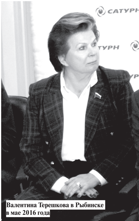
Валентина Терешкова в Рыбинске в мае 2016 года

«Эй, небо,ними шляпу», - поднявшись 16 июня 1963 года с этими словами в космос, Валентина Терешкова вошла в историю человечества и стала живой легендой. 6 марта ярославне, первой в мире женщине-космонавту, исполнилось 80 лет. Но она по-прежнему энергична и помогает землякам словом, делом и песней.