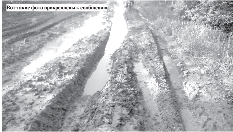
Вот такие фото прикреплены к сообщению

11 декабря в Интернете стартовал Проект Общероссийского народного фронта «Дорожная инспекция ОНФ/Карта убитых дорог».