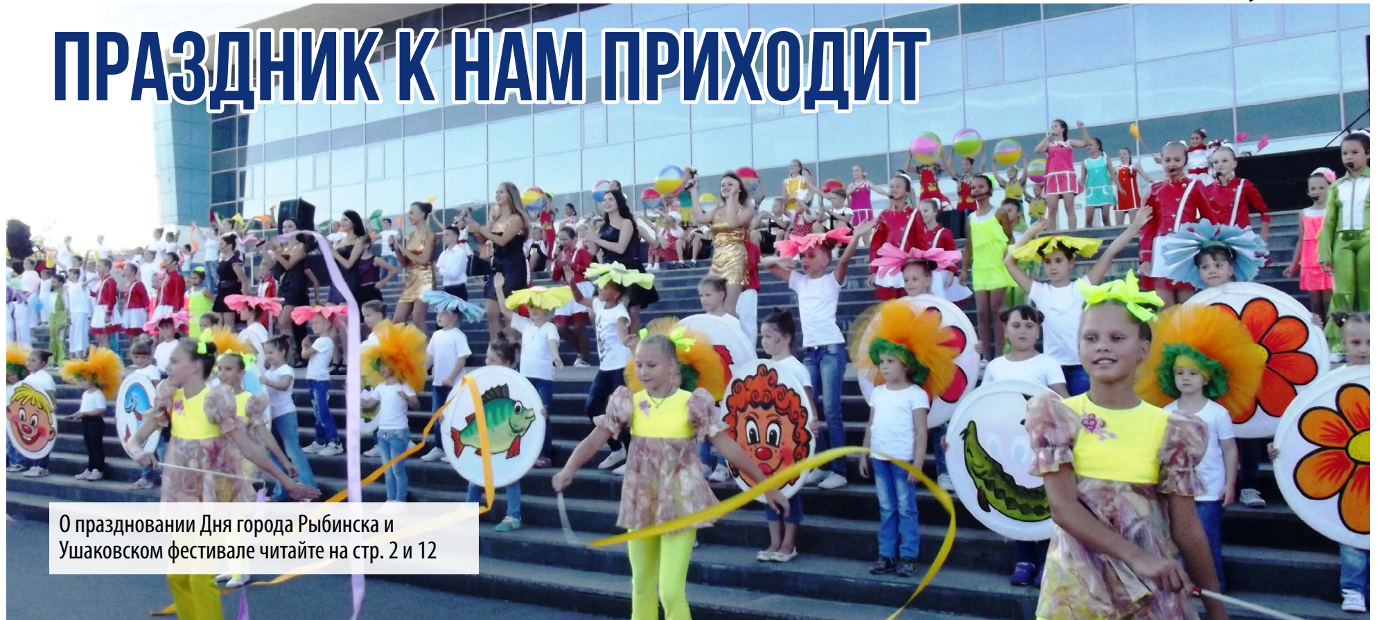
О праздновании Дня города Рыбинска и Ушаковском фестивале читайте на стр. 2 и 12

Уважаемые рыбинцы! Сердечно поздравляю Вас с Днём города Рыбинска! Желаю Вам счастья, здоровья, благополучия!