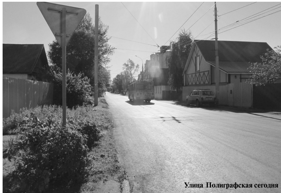
Улица Полиграфская сегодня