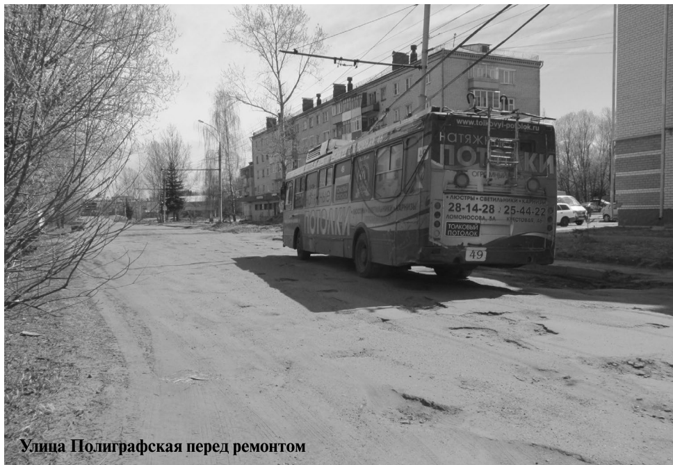
Улица Полиграфская перед ремонтом

На снимках: так в ходе ремонта преобразились улицы Волочаевская и Полиграфская в Марьевке