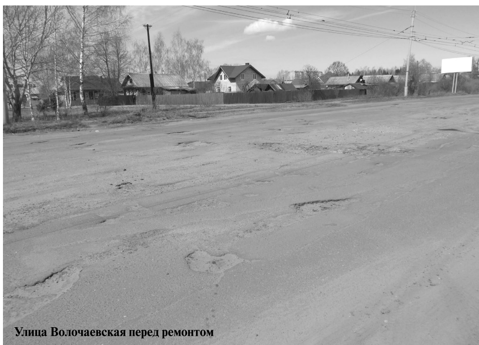
Улица Волочаевская перед ремонтом