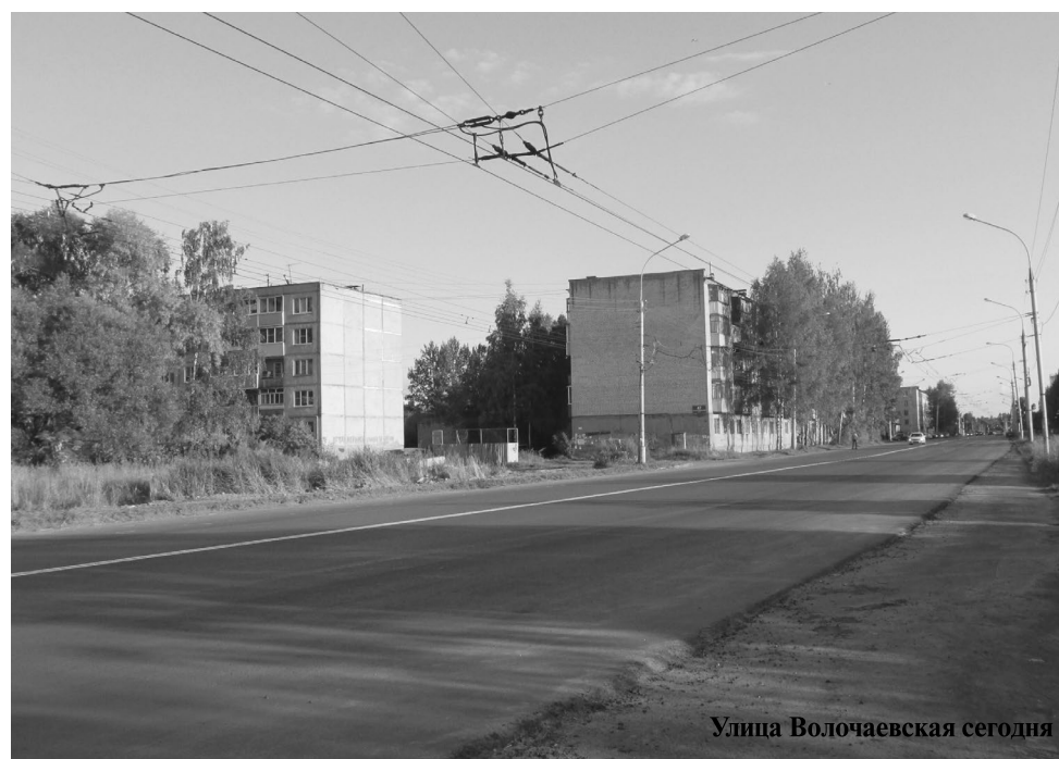
Улица Волочаевская сегодня