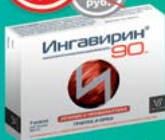
Ингавирин, 7 капсул 90 мг