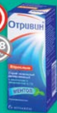
Отривин спрей, 0.1% 10 мл