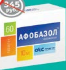
Афобазол, 60 таблеток 10 мг